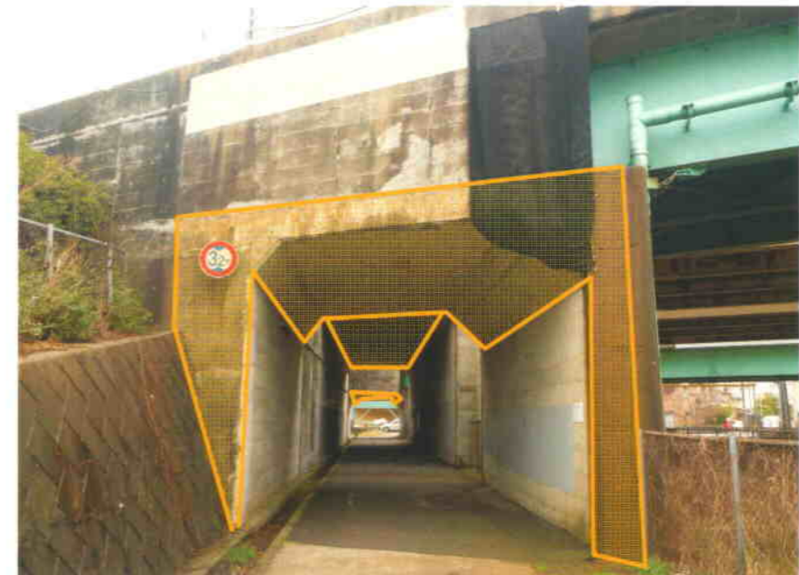
国道8号線より市街地方を望む