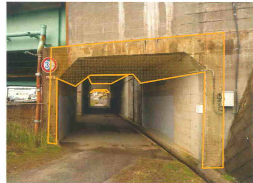
市街地より国道8号線方を望む