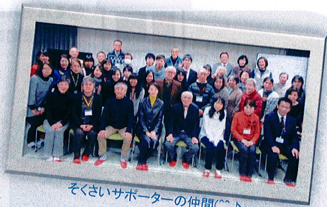
そくさいサポーターの仲間(^_^)