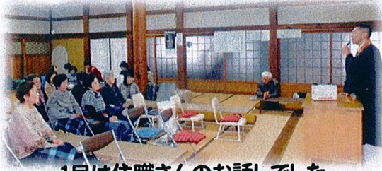
1月は住職さんのお話でした