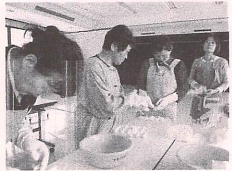
ゴム手袋をして団子作り

毎年恒例のゴキブリ団子作りは千坂公民館ホールで 1時30分～3時行われました。参加されたみなさんは準備 してあったホウ酸・砂糖・小麦粉と玉ねぎのすりおろし・ 牛乳を慣れた手つきでこねて団子にします。初めての人も 役員の説明を聞きながら、他の皆さんと和気あいあいと団 子を作りました。61名の参加がありました。