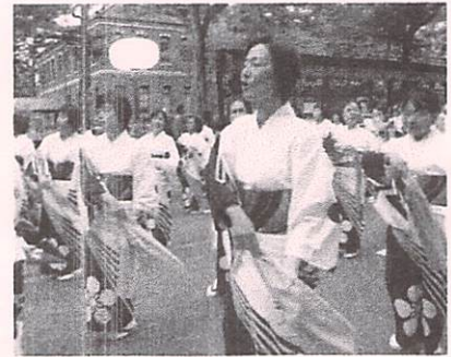
夕暮れの香林坊で踊る千坂校下婦人会の19人の皆さん