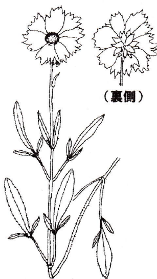
オオキンケイギク (キク科 多年草)