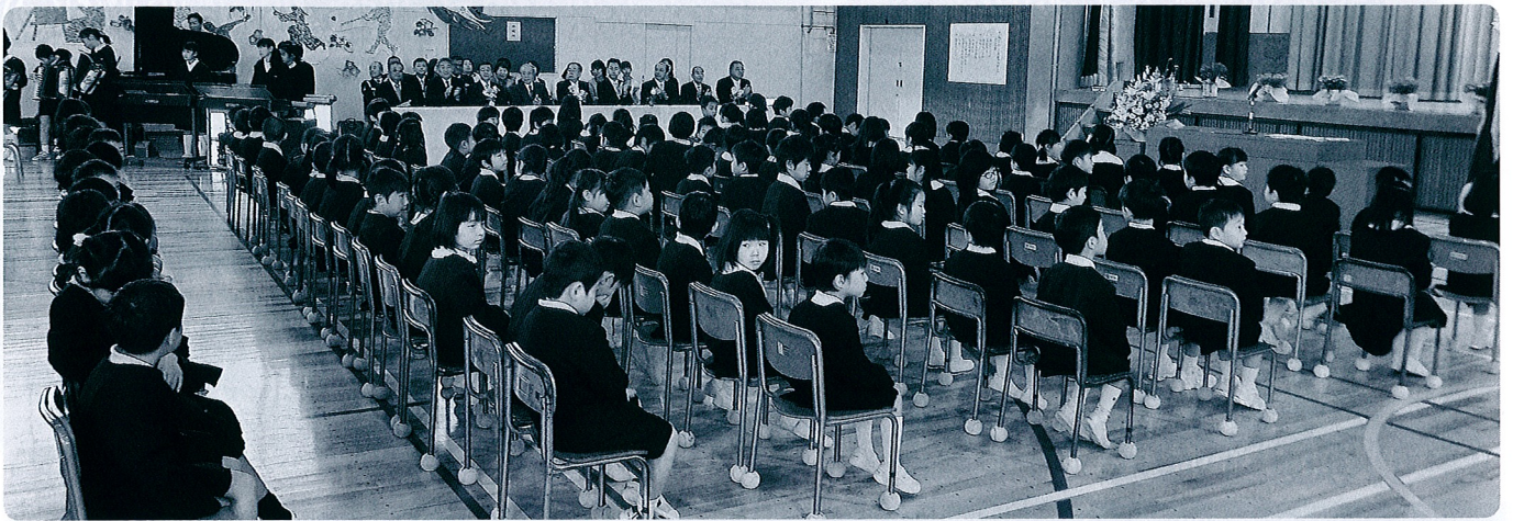
期待に胸ふくらませ117人の新1年生が入学。