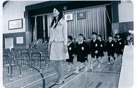
少し緊張した表情で新1年生入場。

今年度は新入生一七名を迎え、全校児童数は六四六名になりました。長子数は四八三名です。これだけたくさんのお子さんをお預かりして平成二八年度がスタートしました。教職員一同、気持ちを一つにして取り組んでいきます。さて、千坂小学校には目指す児童像があります。「ち・さ・か」にちなんだ次のような子です。 ・ちえのある子 ・さわやかな子 ・かかわりあう子 前々からこの学校が目指してきた児童像です。短い言葉の中に、大切なことが凝縮されている、本当に素晴らしい子どもの姿だと感じました。また、これはこのまま「子」を「大人」と置き換えても通用する姿です。 今後、この言葉を合言葉に、子ども達を育てていきます。そして、われわれ教職員も良きモデルとなるように頑張ります。ご支援とご協力をよろしくお願い致します。