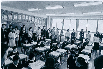
教室でも行儀よく着席。