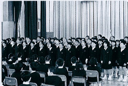
6年生が素晴らしい校歌合唱で歓迎。