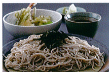
大好評 奈川産手打ちそば