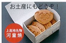
お土産にもどうぞ! 上高地名物 河童焼