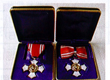
金色有功章 (個人:勲章式) [左:男性・右:女性]