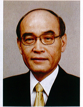
日本赤十字社石川県支部長 谷本 正憲

何卒、赤十字の趣旨、活動の目的をご理解いただきまして、温かいお力添えを賜りますようお願い申し上げます。