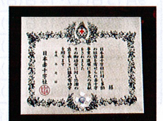
銀色有功章 (個人・法人楕型)