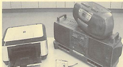
小型家電類（電気コードのついた製品および電池製品）