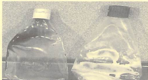
容器包装プラスチックのうち、水でひと洗いで汚れが取れないものとチューブ類