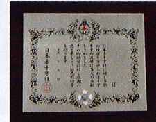
銀色有功章 (個人・法人：楕式)