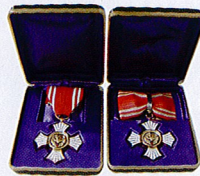
金色有功章 (個人：勲章式) [左：男性・右：女性]