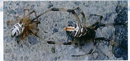
▲子グモ 体色：背中側に白い横しま模様