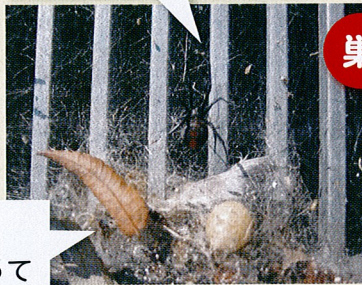
▲セアカゴケグモの巣