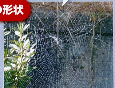
▲一般的なクモの巣