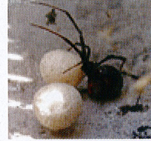
▲卵のう(卵が入った袋) 大きさ：直径約8mm