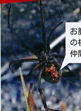
◀メスの腹面