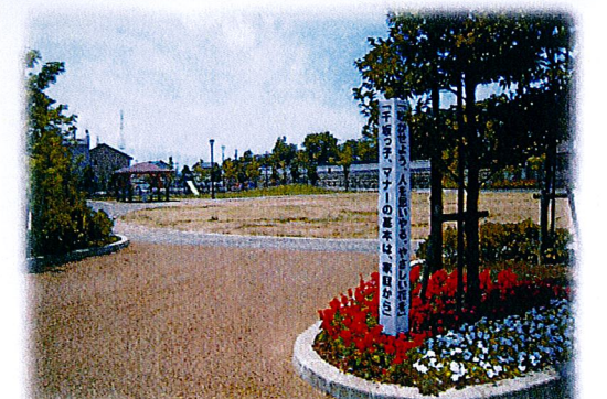
千木日吉の森公園の標柱