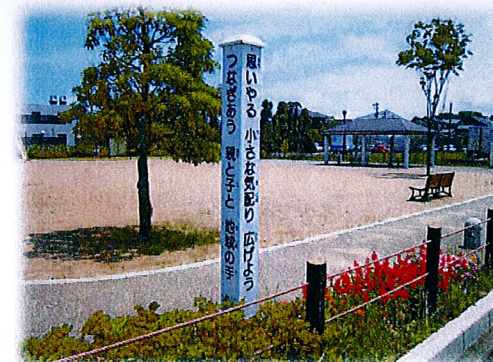
金市やすらぎ公園の標柱

毎年募集している「青少年健全育成標語」は、平成2年からの継続事業です。 優秀作品は標柱に記し、既に17本が千坂校下の各公園に立てられ、子ども達の健やかな 成長を願う地域の人たちに見守られています。 また、「館報千坂」の表紙に毎号掲載しておりますので、ご覧ください。