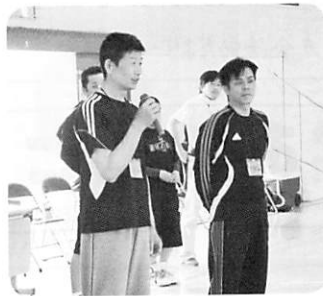
ドッジボール上達法伝授!!

千坂ドッジの選手vsお父さんチームの試合もあり、お父さんたちにとって熱い体験教室となりました。