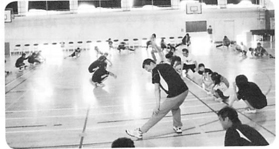
準備体操 イチ・ニ・イチ・ニ