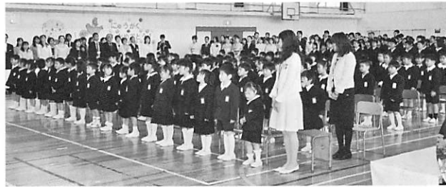
新1年生104名を迎えました