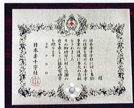
銀色有功章 (個人・法人:楕円)