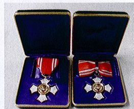
金色有功章 (個人:勳章式)(左:男性・右:女性)